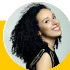
Adèle Charvet (mezzosopraan)