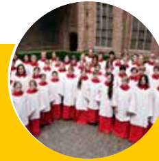
Kathedrale Koor Utrecht